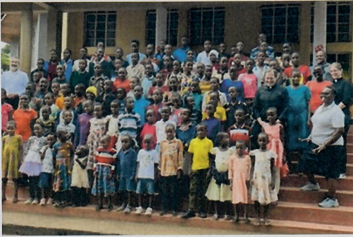
Gruppenfoto beim Waisentreffen in Himo