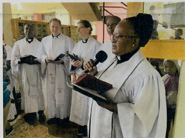
Gottesdienst in Uowo