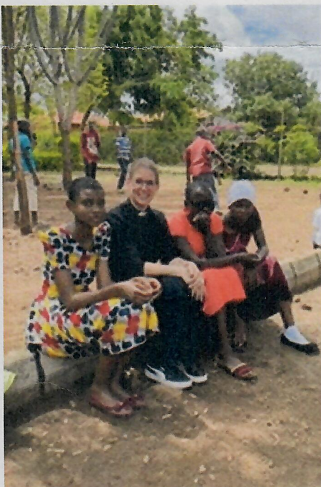
Gespräche beim Waisentreffen in Himo