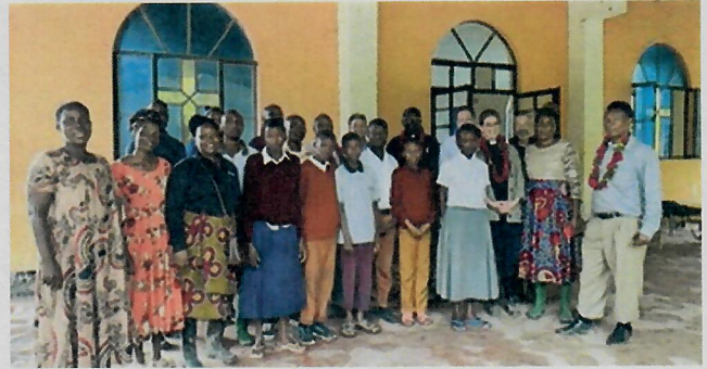
Treffen mit Fieldworkern in Mwangaria