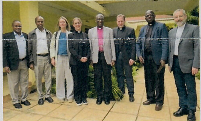
Konferenz mit Bischof Shoo